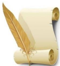
Устав планеты «Улыбка»